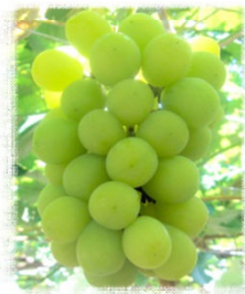
シャインマスカット

毎年のお引き立て誠にありがとうございます。 本年のぶどうの販売予定と価格をご案内させていただきます。 本年も御愛顧賜りますようお願い申し上げます。